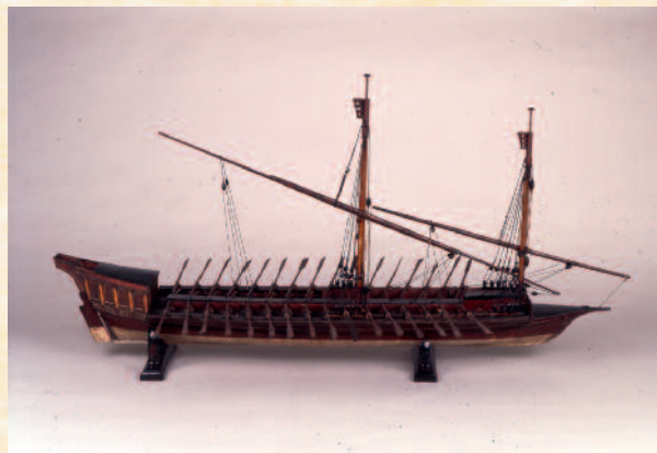
Modelo de arsenal de galeota Museo Naval de Madrid

perderse unos meses después junto con la fortaleza de la Goleta. En 1575, cuando regresaba a España para solicitar el mando de una compañía, fue apresado por corsarios argelinos que le mantuvieron cautivo durante cinco años. Tras cuatro intentos de fuga y cuando estaba a punto de ser trasladado a Constantinopla con dos cadenas y un grillo , fue liberado y pudo regresar a España. Llevó entonces a cabo una comisión reservada en Mostagán y Orán, y al año siguiente participó en la campaña de Portugal, con ocasión de su incorporación a la monarquía de España. Su intervención con el Tercio de don Lope de Figueroa en la victoria naval de la isla de San Miguel, en las Azores, es discutida y, de ser cierta, constituiría su última campaña. Aun así, desde 1584 hasta la década de 1590 siguió vinculado a la marina, esta vez como aprovisionador de la Armada del Mar Océano y de la Gran Armada.