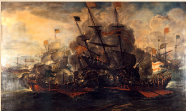
Combate naval y turcos saltando al abordaje Juan de la Corte C. 1613 Óleo sobre lienzo Depósito del Museo del Prado

el mismo Tercio, en la victoria de Lepanto del 7 de octubre de 1571, dirigida a frenar el avance otomano en el Mediterráneo. Sus compañeros relataron después cómo en esa jornada, a pesar de estar enfermo, decidió combatir porque más quería morir peleando por Dios y por su rey que no meterse so cubierta . En 1572, restablecido de las heridas producidas en la más alta ocasión que vieron los siglos pasados, los presentes, ni esperan ver los venideros , fue asignado a la compañía de don Manuel Ponce de León, del Tercio de don Lope de Figueroa, el Tercio de la Armada, que absorbió al de Moncada. Con él actuó en la efímera reconquista de Túnez, que volvió