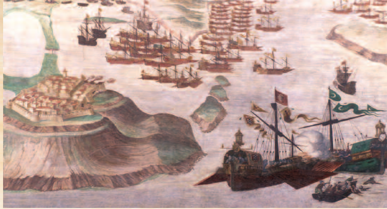
Combate de Navarino Pintura mural (Reproducción) Archivo-Museo General de Marina Álvaro de Bazán

Cervantes fue soldado de mar. Si bien se ha dudado de su participación en el socorro de Chipre de 1570 como soldado del Tercio de don Miguel de Moncada, es en cambio celebrísima su intervención al año siguiente, encuadrado en