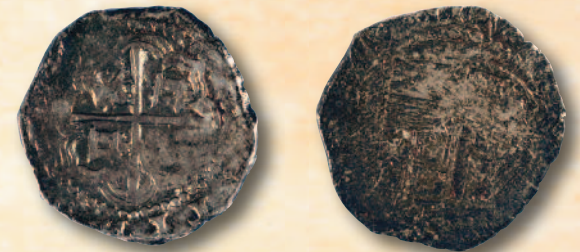
Monedas de 2 reales de Felipe II y Felipe III Acuñadas en México Plata Museo Naval de Madrid

El recorrido que en el aniversario de su muerte propone el Museo Naval, es un homenaje a Cervantes, soldado de mar , en el entorno idóneo para recordar esta faceta que dejó honda huella en la memoria del genial escritor. Con el propósito de no desvincular ambas cuestiones, su creación literaria y su servicio a la Armada, las piezas que ilustran sus años de soldado de mar se