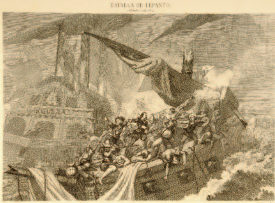
Cervantes peleando en la galera Marquesa.